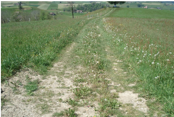
3 Trittflurvegetation entlang Bewirtschaftungsweg