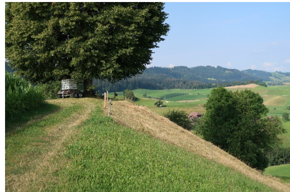
6 Einzelbäume / Gebüsch in Dauerweide