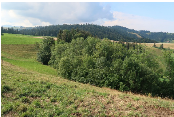
7 Baumhecke südlich der Weide