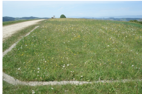
4 Abstellfläche mit extensiver Wiesenvegetation