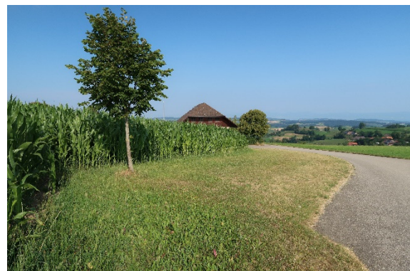
8 Einzelbäume mit Abstellplatz