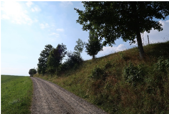
5 lückige Hecke innerhalb nordexponierter Böschung