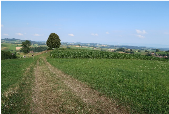
1 Fruchtfolge (Getreide / Mais / Fettwiese)