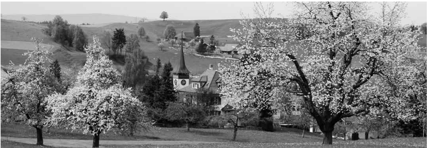
Blick von Dangeliacker auf die Kirche