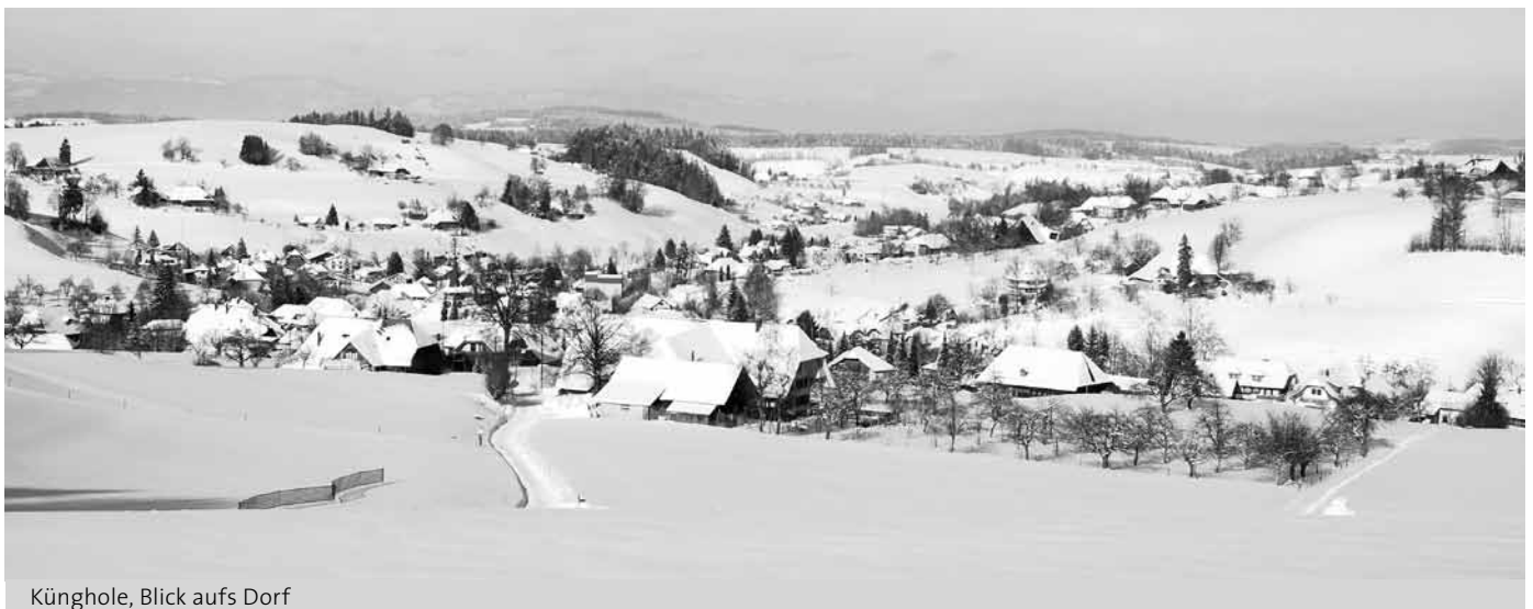
Künghole, Blick aufs Dorf

Damit wir die Dorfzeitung stets interessant und abwechslungsreich gestalten können, benötigen wir immer wieder neue Fotos. Haben Sie zu Hause Fotos von der Eriswiler Landschaft, welche Sie uns für die Dorfzeitung gerne zur Verfügung stellen möchten? Wir sind froh um alle neuen Bilder. Sie können uns Ihre Fotos per E-Mail an bernhard@eriswil.ch oder auf CD gebrannt zustellen.